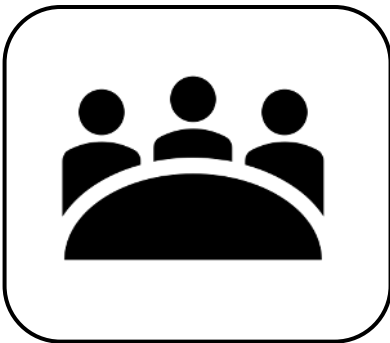
Mens & Maatschappij

We steken de gebiedsprocessen in op een hedendaagse wijze. Waarbij we, naast onze gezamenlijke opgave, met minder vooraf opgestelde vaste patronen en kaders aan de slag gaan. We streven naar een open dialoog, waarbij gezocht wordt naar de wederzijdse aanwinsten voor de invulling van onze opgave. We geven de gebiedsontwikkelaars (samenleving) binnen het proces de kans en beschikbare ruimte om met een aanpak en invulling te komen van de opgave.